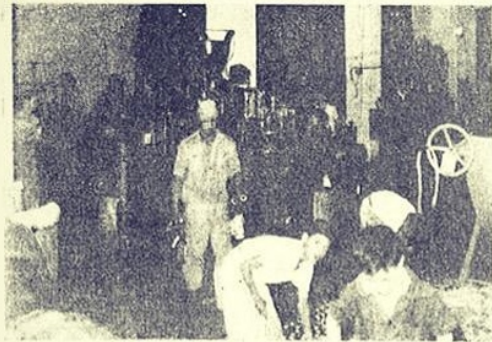
Grupo automático de engarrafamento, rolhamento e rotulamento.